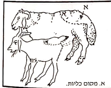
240. רש"י ד"ה ואם, לעומת העצה ממקום שהכליות וכו'.